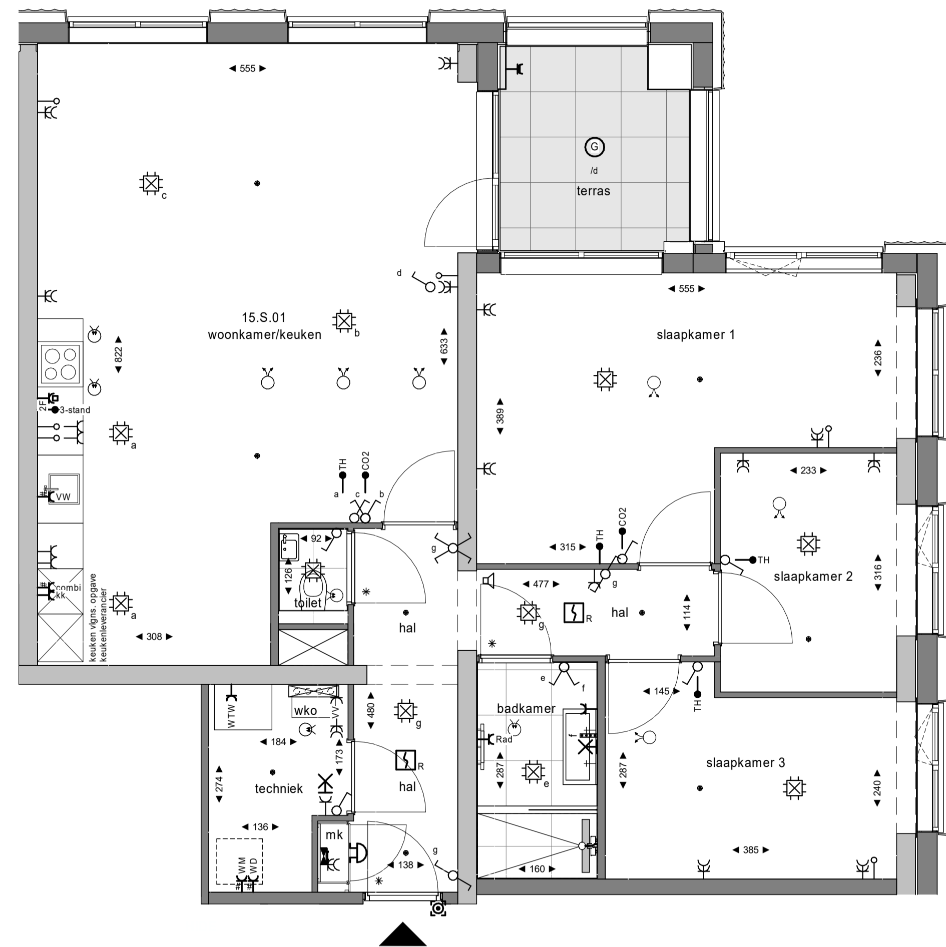
plattegrond 1 : 50 15e verdieping